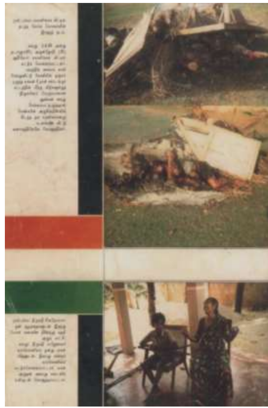
படம் 4 -I