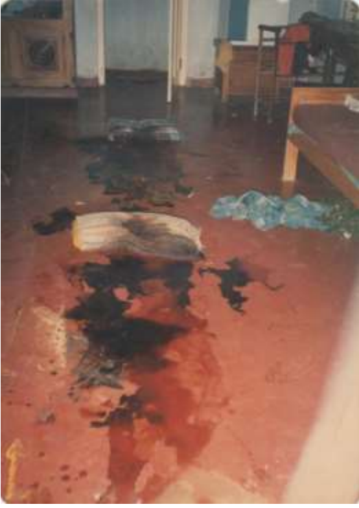
மூன்று நாட்களுக்குப்பின் சடலங்களை அகற்றிய பின் உள்ள இரத்தோட்டக்காட்சி