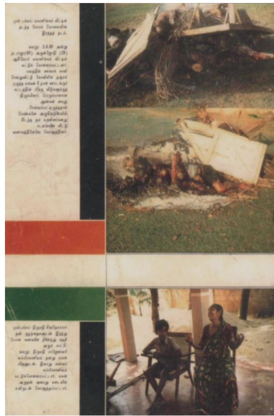
படம் 4 -I