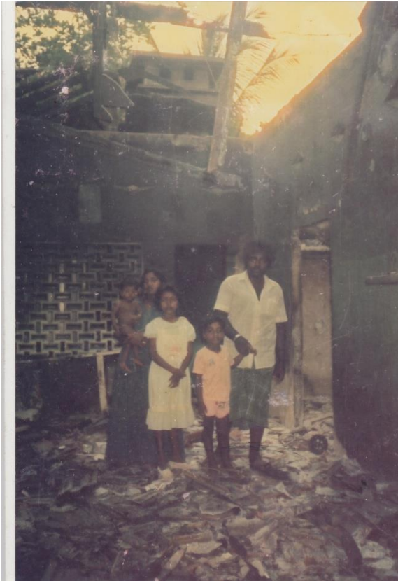
← படம் 5

எரியூட்டப்பட்ட தமது வீட்டினை தம் குடும்பத்தினருடன் பார்வையிடும் ஒரு அரச உத்தியோகத்தர் குடும்பம்.