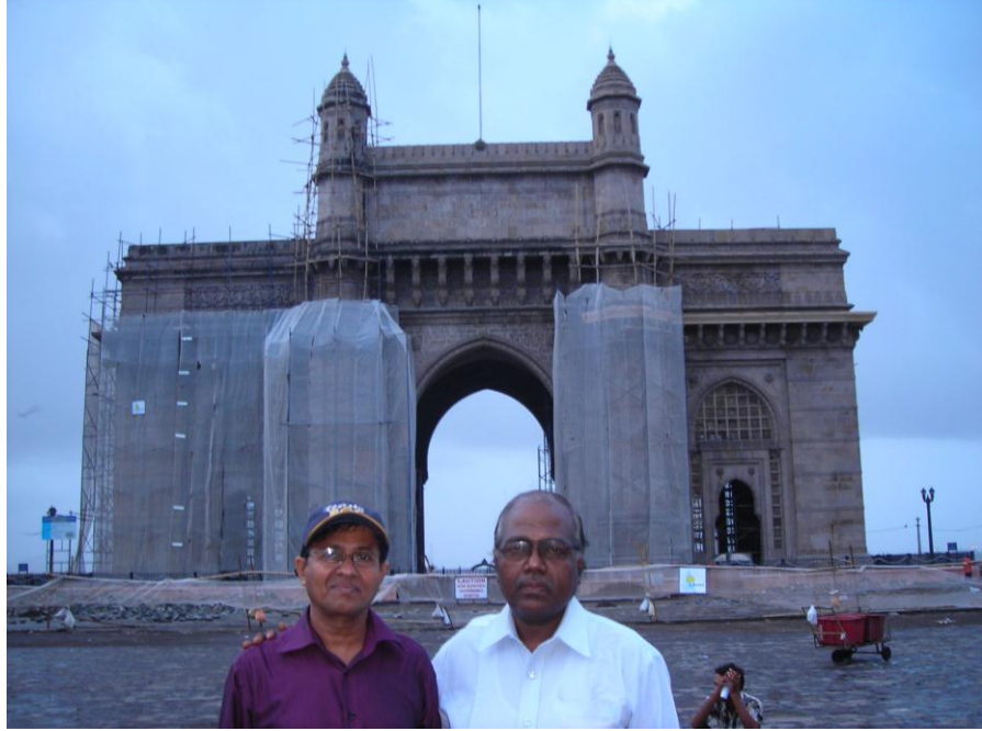
Gate way of India முன்புறமாக கட்டுரையாளரும் நண்பரும்

“Irrected to Commorate the Landing of their Imperial Magistrict King Georg V and Queen Mary on the 2 nd of Dec. MCMX1.”