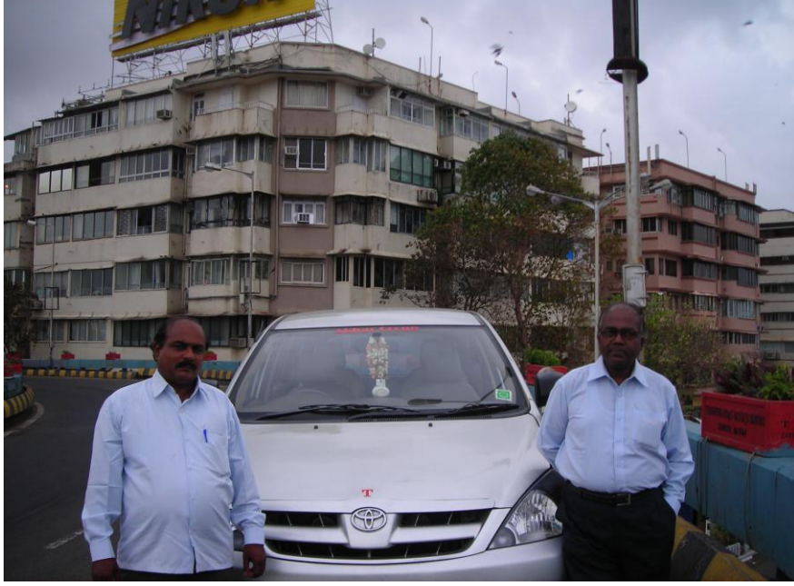
நாம் பயணம் செய்த வாகனத்துடன் வழிகாட்டி ராஜாவும் கட்டுரையாளரும்

சிறந்ததொரு வாகனம் (Car) தரப்பட்டது எமது பொதிகள் அனைத்தும் பின்புறம் வசதியாக வைக்கப்பட்டு பாதுகாப்புடன் முன் ஆசனங்களில் நாம் அமர்ந்து புறப்பட ஆயத்தமானபோது அச்சாரதி மிகவும் கம்பீரமாக “Good Morning Sir” எனக் கூறி நல்லதொரு காலைப்பொழுதை ஆரம்பித்து வைத்தார். அந்த நேரம் பயணம் செய்வது மிகவும் இதமாக இருந்தது. அதுவும் என் ஆசையை நிறைவேற்றும் முதல்படியாக அமைந்த நேரமல்லவா?