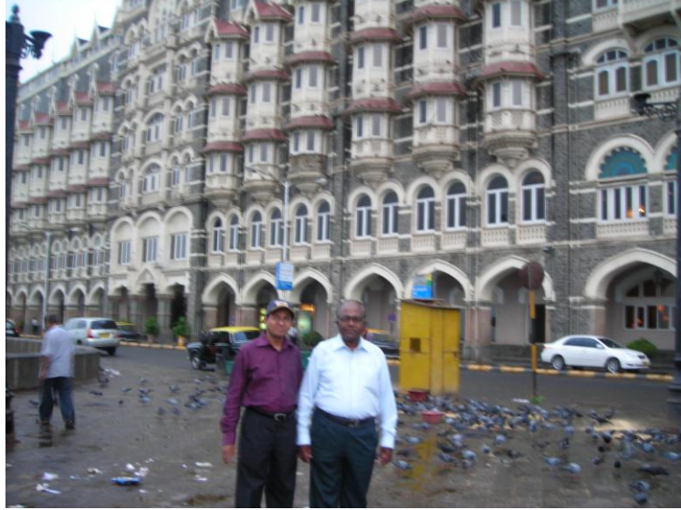
Taj Hotel முன்பாக புறாக்களுடன்