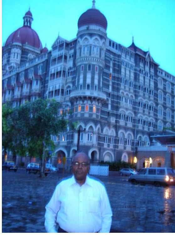
Taj Hotel முன்பாக கட்டுரையாளர்