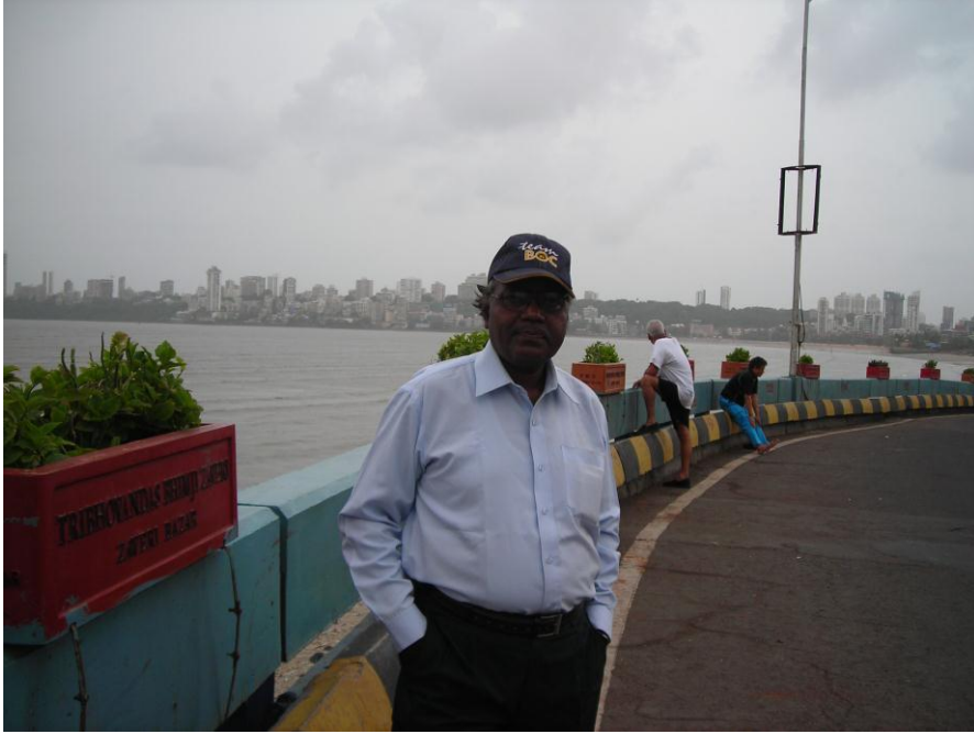
மும்பை நகர எல்லையில் கட்டுரையாளர்